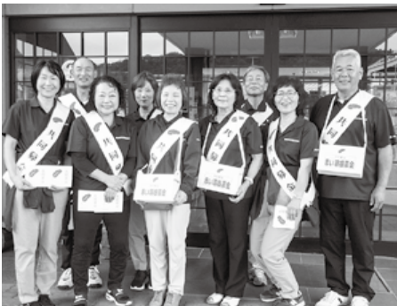
民生委員・児童委員様