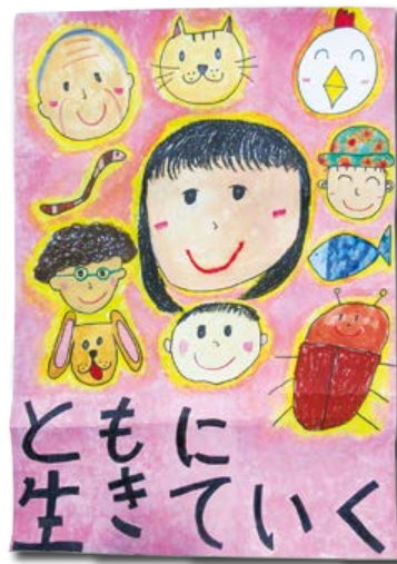
「ともに生きていく」