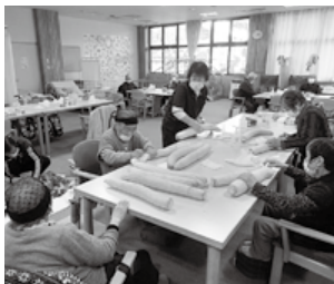
デイサービス食レク

法令を遵守しながら、要介護者・要支援者及びご家族の方々との信頼関係を大切にして利用者個々のニーズに適切に対応したサービス提供を目指しました。 居宅介護支援事業、訪問介護事業(訪問型サービス)、地域密着型通所介護事業(通所型サービス)